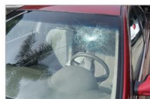
Plusieurs fissures sur le pare-brise, dans la zone de balayage des essuie-glaces.