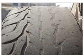
Corde visible sur un pneumatique ou profondeur d'au moins une rainure inférieure à 1,6 mm

Exemples de principales défaillances critiques :